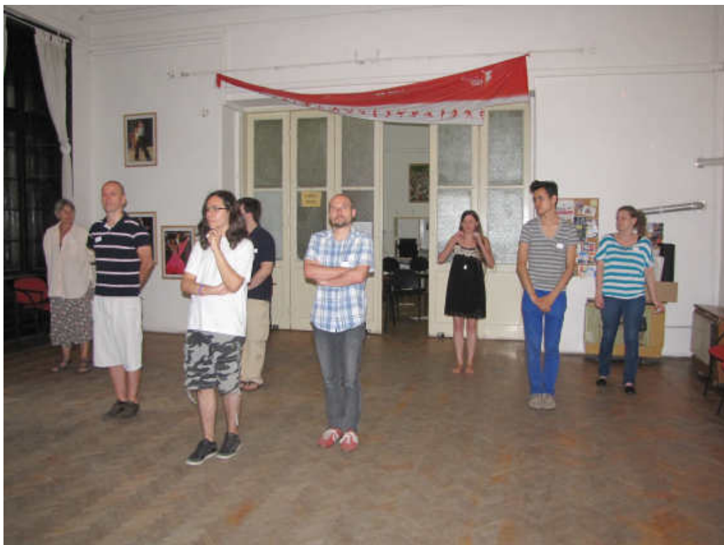
A „tég egy lépést előre” érzékenyítő gyakorlat