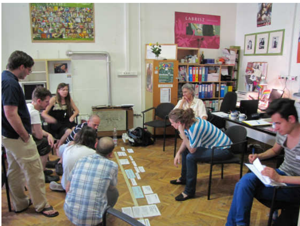
Cselekvési kontinuum elkészítése

A második napra 14 fő jött el, az előző napi 8-hoz csatlakozott a fejlesztendő csoportjaink 4 képviselője a - Something Else – SOTE meleg diákcsoportjából és a - GBME –műegyetemi csoportjából, illetve a Szimpozion önkéntesei közül jött el még 2 fő.